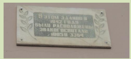
АГМ ф. Р-602 оп. 1 д. 7 л. 172

В 2002 г. на здании школы № 3 (ул. Штабная, 26) установлена мемориальная доска.